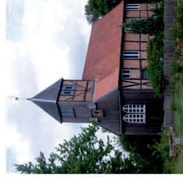
Kirche St. Anna Niendorf