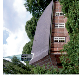
Marienskapelle Gr. Schretstaken